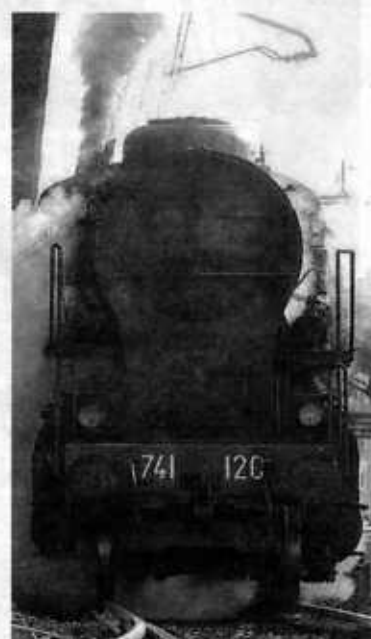
TRENO A VAPORE Viaggio il 29 da Pistoia a Pracchia